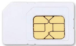
mini SIM Card 2FF 15 x 25 mm