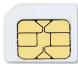
micro SIM Card 2FF 12 x 15 mm